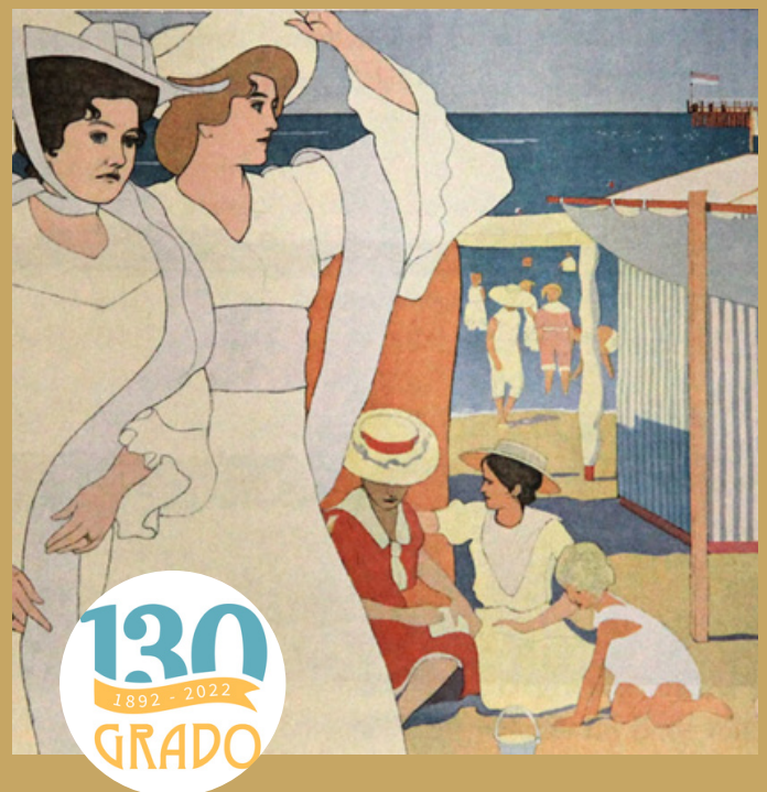
Josef Maria Auchentaller, "Seebad Grado: Österreichisches Küstenland", 1906 (Wien Museum)